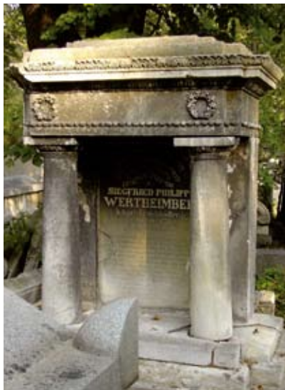
Wertvolles Grabmal eines „Tolerierten“ im ägyptisierenden Stil.