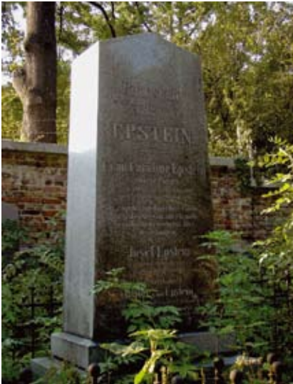
Grabstelle der Familien Epstein und Teixeira de Mattos.