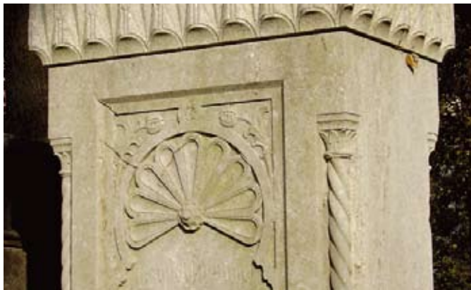
Granatapfel als Lebenssymbol, Foto: Tina Walzer