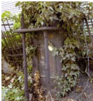
Einziges erhaltenes Grabmal aus dem damals modernen Material Gusseisen.

Hier war wahrscheinlich ein Sammelbehälter für Spenden angebracht, lediglich Reste des eisernen Scharniers sind erhalten.