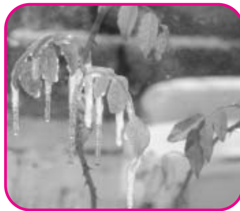
Überleben in sozialer Kälte