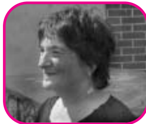
Bei der Eröffnung von Stationen des Wegs der Erinnerung in der Haidgasse 1, am 17.5.2009